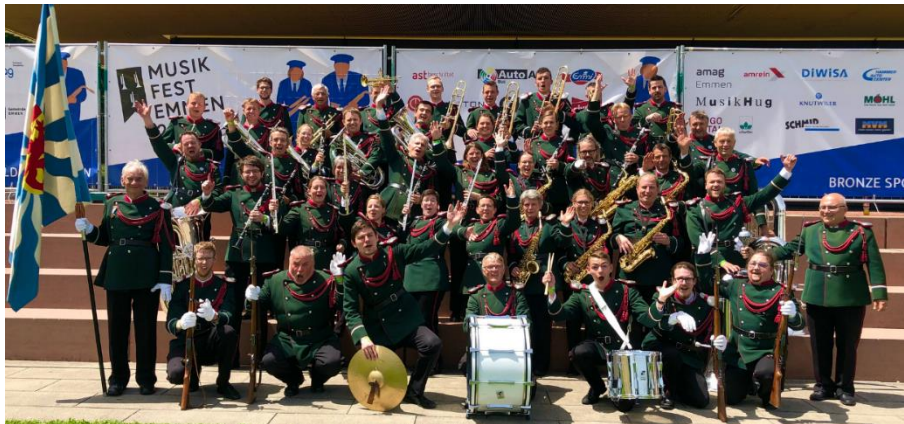
Kantonales Musikfest Emmen 2022

Das Jahresprogramm der MGHS ist gleichzeitig abwechslungsreich und beständig. Im Frühlingshalbjahr konzentrieren wir uns neben den kirchlichen und traditionellen Anlässen im historischen Städtli auf unser Frühlingskonzert. Dabei sind wir offen für neue Ideen und wechseln zwischen Tanzabend, Kirchenkonzert oder einem Gemeinschaftskonzert.